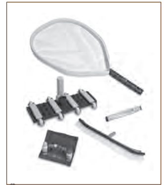
Kit de mantenimiento Aquex 203029

Kit de mantenimiento (incluye barredora, red saca-hojas, analizador, cepillo y termómetro)